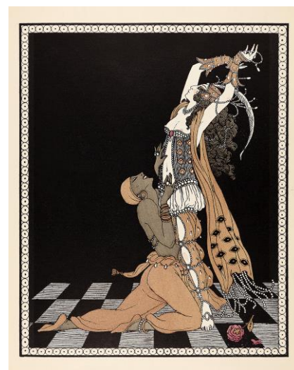
ジョルジュ・バルビエ

日比谷図書文化館 広報担当：並木 namiki-yuri@shopro.co.jp / 中村 nakamura-shoko@shopro.co.jp 〒100-0012 東京都千代田区日比谷公園 1-4 TEL：03-3502-3340 / FAX：03-3502-3341 ホームページ：https://www.library.chiyoda.tokyo.jp/hibiya/