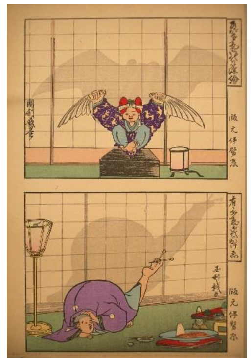
「有が多気御代のかけ絵」歌川国利／年代不明