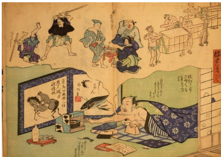
「浮世八夢だ夢だ」 作者不詳／慶応期 (後期展示)

日比谷図書文化館は、「江戸からたどるマンガの旅 ～鳥羽絵・ポンチ・漫画～」を開催します。 日本のマンガのはじまりについては諸説ありますが、本展では、マンガは多くの人々が親しむ大衆メディアであることを前提とし、印刷出版文化が発達した江戸中期の「戯画」を旅の出発点にします。 鳥羽絵から始まり、江戸のヒットメーカーであった歌川国芳、幕末・明治に活躍した河鍋暁斎など人気浮世絵師が描いた戯画や明治・大正期に活躍した北沢楽天、岡本一平の作品、昭和初期の数々の漫画雑誌まで、京都国際マンガミュージアム所蔵の貴重なコレクションにより、約230年を旅しながら、現代のマンガへいたる流れをたどっていきます。