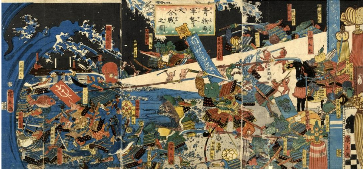
「青物魚軍勢大合戦之図」歌川広景／1859年（後期展示）

安政5年のコレラ大流行を背景に、コレラにかかりやすい食物・魚とかかりにくい食物・青物（野菜）との争いを描いている。実際は幕府内部の一橋派と南紀派の抗争を描いたもので、右の青物の大将「みかん太夫」は14代将軍家茂を描いている。左の魚の大將「しゃち太子」は一橋慶喜である。